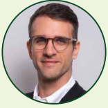
Leopold Böhm BuildingMinds