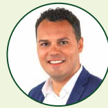
Patrick Lange agradblue