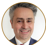
Metehan Sen Senator Invest