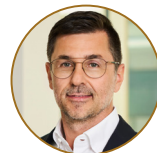
Jens Hausmann Groß & Partner