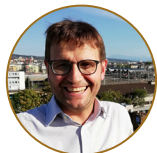
Roland Gaßner Travel Data + Analytics