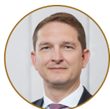
Roland Paar SoHospitality